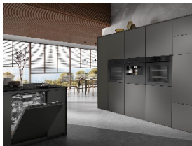
Foto 1: Zum 125-jährigen Jubiläum präsentiert Miele die grifflose ArtLine-Serie sowie Induktionskochfelder und eine Dunstabzugshaube im edlen Farbton Obsidianschwarz matt. Zusätzlich zur regulären Miele Garantie ist eine kostenfreie Garantieverlängerung von 125 Wochen möglich.