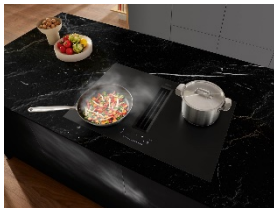
Foto 2: Das Induktionskochfeld mit integriertem Dunstabzug TwoInOne (KMDA 7876 FL) mit MattFinish ist edel in Haptik und Optik und dabei widerstandsfähig gegenüber Kratzern. Ein weiteres Plus der strukturierten Oberfläche mit Anti-Fingerprint-Effekt ist, dass kaum noch Fingerabdrücke zu sehen sind. On Top in der 125 Gala Edition: eine kostenfreie Garantieverlängerung um 125 Wochen. (Foto: Miele)

Foto 1: Zum 125-jährigen Jubiläum präsentiert Miele die grifflose ArtLine-Serie sowie Induktionskochfelder und eine Dunstabzugshaube im edlen Farbton Obsidianschwarz matt. Zusätzlich zur regulären Miele Garantie ist eine kostenfreie Garantieverlängerung von 125 Wochen möglich. (Foto: Miele)